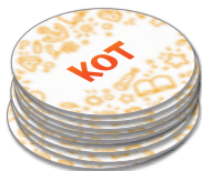
Набор с короткими словами