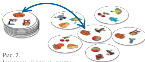
Рис. 2. Начальный вариант игры

Все жетоны на столе лежат картинками вверх, игроки смотрят свои жетоны тоже со стороны картинок. Задача игрока — найти парный жетон с такой же картинкой (хотя бы одной!), забрать его к себе в стопку картинкой вверх, и искать теперь пару к нему.