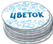
Набор с длинными словами