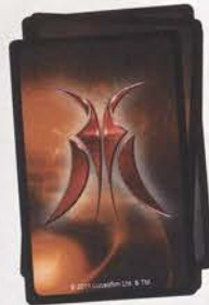
Боевые карточки Сепаратистов 48 шт.