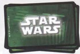
Карточки заданий 32 шт.