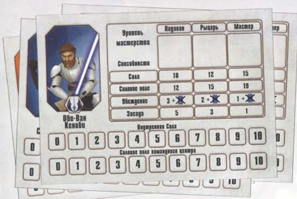
Карты персонажей 4 шт.