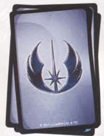
Боевые карточки Республиканцев 48 шт.