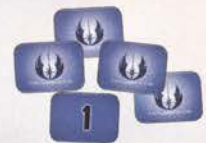
Планетарные жетоны 40 шт.