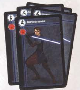
Карточки героев и поединка 12 шт.