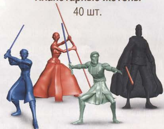
Фигурки героев 4 шт.